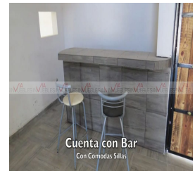
Cuenta con Bar Con Comodas Sillas