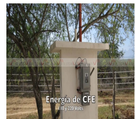
Energía de CFE 110 y 220 Volts