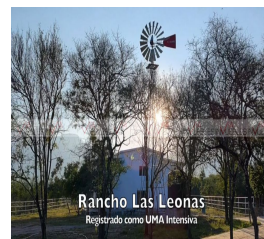
Rancho Las Leonas Registrado como UMA Intensiva