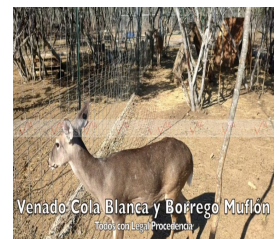
Venado Cola Blanca y Borrego Muflón Todo con Lic. Proveniente