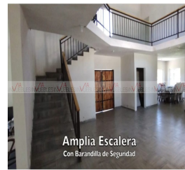
Amplia Escalera Con Barandilla de Seguridad