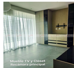
Mueble TV y Closet Recámara principal