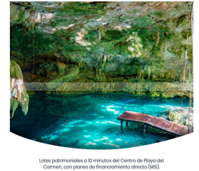
Lotes patrimoniales a 10 minutos del Centro de Playa del Carmen, con planes de financiamiento directo (60%).