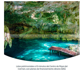
Lotes patrimoniales a 10 minutos del Centro de Playa del Carmen, con planes de financiamiento directo (6%)