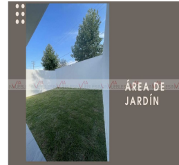
ÁREA DE JARDÍN