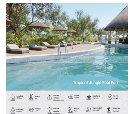
Tropical Jungle Pool Park