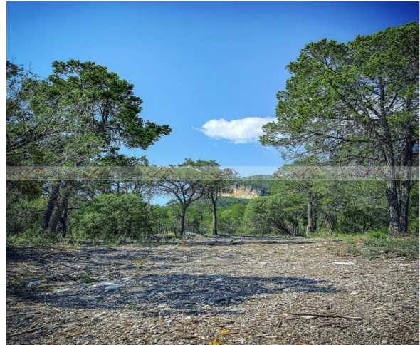
• CUMBRE DIAMANTE •

Ave. Gómez Morin No. 100 Local N1-03 esquina con Ave. Roberto Garza Sada, Col. Carrizalejo San Pedro Garza García N.L. C.P. 66290 Tel. + 52 (81) 8218.8939 Tel. + 52 (81) 8378.6238 Email: info@gvia.mx www.gvia.mx