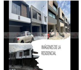
IMÁGENES DE LA RESIDENCIAL