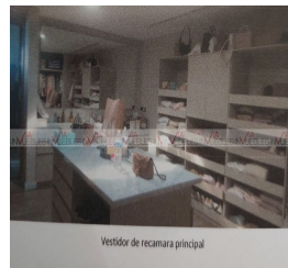
Vestidor de recámara principal