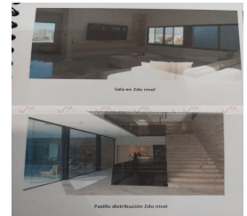
Sala en 2do nivel