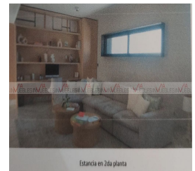
Estancia en 2da planta