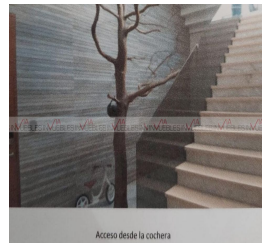
Acceso desde la cochera