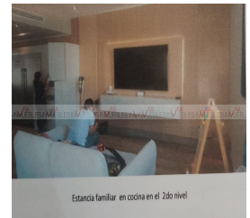
Estancia familiar en cocina en el 2do nivel