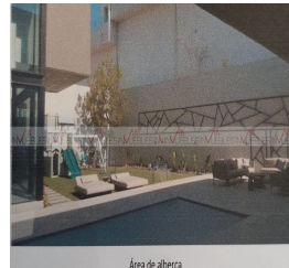
Área de alberca