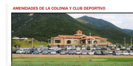
AMENIDADES DE LA COLONIA Y CLUB DEPORTIVO El costo mensual de cuotas de Herradura son los siguientes: • Residentes: $ 2.275.00 M.N.