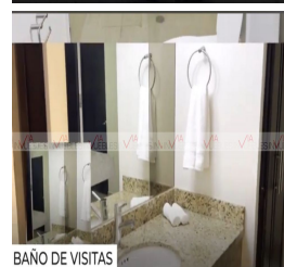
BAÑO DE VISITAS