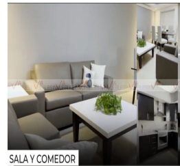
SALA Y COMEDOR