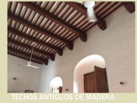
TECHOS ANTIGUOS DE MADERA