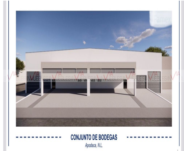
CONJUNTO DE BODEGAS Apodaca, N.L.

Ave. Gómez Morin No. 100 Local N1-03 esquina con Ave. Roberto Garza Sada, Col. Carrizalejo San Pedro Garza García N.L. C.P. 66290 Tel. + 52 (81) 8218.8939 Tel. + 52 (81) 8378.6238 Email: info@gvia.mx www.gvia.mx