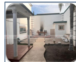
VISTA DE PATIO