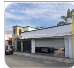
VISTA DE PLANTA ALTA