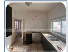
VISTA DE COCINA