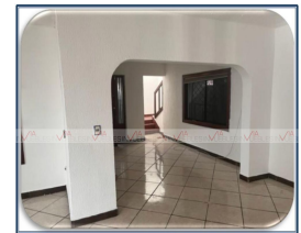
VISTA DE PLANTA BAJA