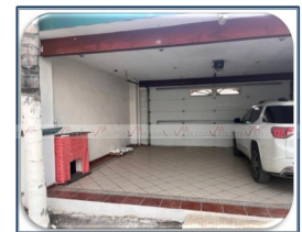
VISTA DE LA COCHERA