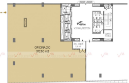
Área Interior Total 372.50 m 2