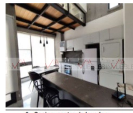
6.- Cocina, centro de lavado y antecomedor.