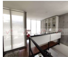
8.- Estudio en planta alta.