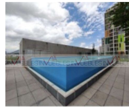
12.- Área común (alberca).