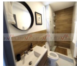
9.- Baño común.