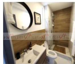
9.- Baño común.