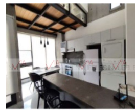
6.- Cocina, centro de lavado y antecomedor.