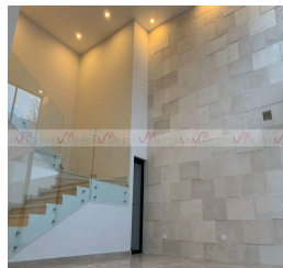
RECÁMARA PRINCIPAL CON DETALLE DE PIEDRA NATURAL CON ILUMINACIÓN LED

*FOTOS TOMADAS DE UNA CASA TIPO ANTERIOR