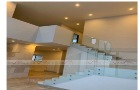
VISTA DE DOBLE ALTURA DE SALA, MURO FORRADO DE CANTERA EN DOBLE ALTURA

*FOTOS TOMADAS DE UNA CASA TIPO ANTERIOR