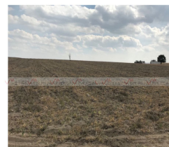
Vista desde carretera Huamantla-Terrete