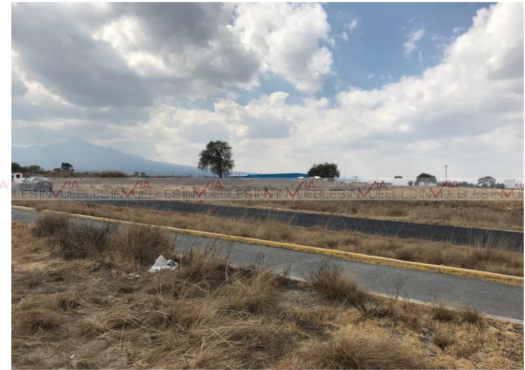
Imagen del terreno hacia Ciudad Industrial Xicoténcatl II