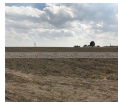
Vista hacia el terreno desde carretera Huamantla- Terrete