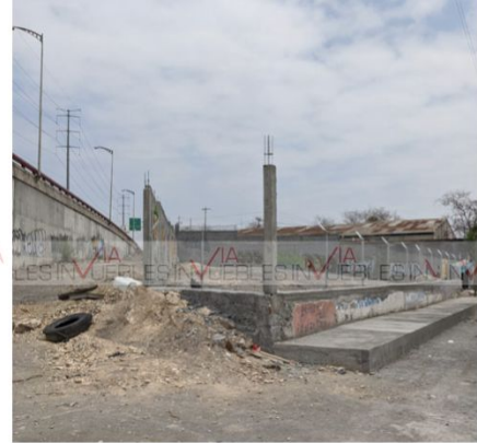
Calle de atras pendiente habilitar por municipio

Ave. Gómez Morin No. 100 Local N1-03 esquina con Ave. Roberto Garza Sada, Col. Carrizalejo San Pedro Garza García N.L. C.P. 66290 Tel. + 52 (81) 8218.8939 Tel. + 52 (81) 8378.6238 Email: info@gvia.mx www.gvia.mx