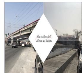
Alto trafico de 3 diferentes frentes