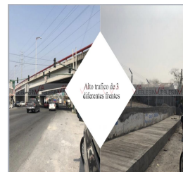
Alto trafico de 3 diferentes frentes