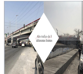
Alto trafico de 3 diferentes frentes