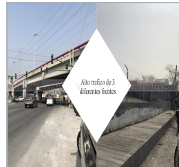
Alto trafico de 3 diferentes frentes