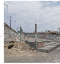
Calle de atras pendiente habilitar por municipio